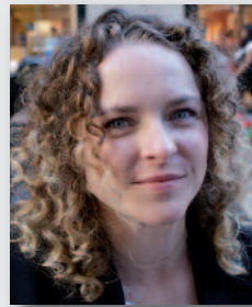
Autorin: SUSANNE SKORUPPA arbeitet freiberuflich an der Schnittstelle von Recht und Organisationspsychologie.

Mit „Closeness at a Distance“ möchten die Autoren des Buchs Teams und Führungskräften eine Schatztruhe praktischer Tipps und Instrumente für die Leistungssteigerung ihrer virtuellen Arbeit an die Hand geben. Ein neues Buch zum Thema Führung in der virtuellen interkulturellen Arbeitswelt ist bereits in Arbeit und wird 2015 ebenfalls bei Libri Publishing veröffentlicht.